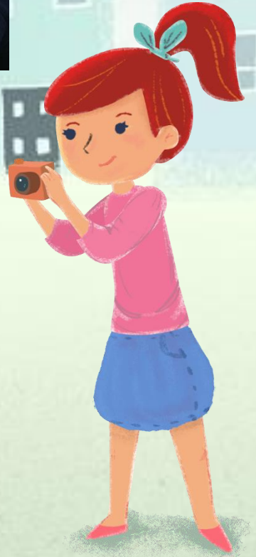
Подобраны детские книги по воспитанию культуры поведения